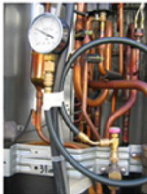
従来のテスト方法の1例